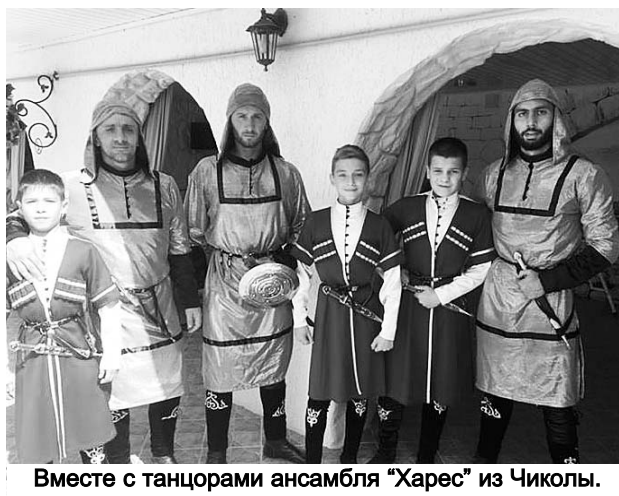
Вместе с танцорами ансамбля "Харес" из Чиколы.