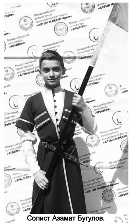
Солоист Азамат Бугулов.