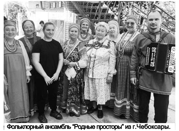
Фольклорный ансамбль "Родные просторы" из г.Чебоксары.